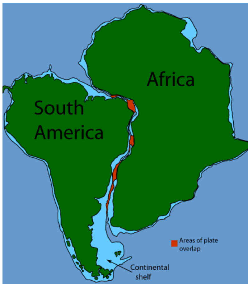
شکل ۱- انطباق حاشیه‌ی شرقی قاره‌ی آمریکای جنوبی با حاشیه‌ی غربی آفریقا.

بیش از یک قرن پیش، دانشمند آلمانی به نام آلفرد وگنر با مطالعه و مشاهده‌ی پدیده‌های سطح زمین متوجه شد که حاشیه‌ی شرقی قاره‌ی آمریکای جنوبی با حاشیه‌ی غربی آفریقا، شباهت‌های زیادی نسبت به هم دارند (شکل ۱).