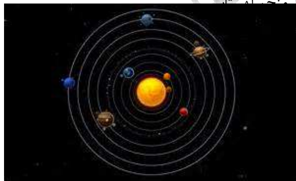
شکل ۲-نظریه خورشیدمرکزی.

در زمان حاکمیت نظریه زمین مرکزی، برخی از دانشمندان، دانشمندان، خواجه نصیرالدین طوسی بود. او در قرن هفتم هجری، نظریه زمین مرکزی را رد کرد. تا اینکه در سال ۱۵۴۳ میلادی، نظریه خورشیدمرکزی، توسط نیکولاس کپلر تا به نام کوپرنیک، مطرح شد. براساس این عقیده، خورشید در مرکز منظومه شمسی، واقع شده است و سیارات در مسیر دایره‌ای به دور خورشید در حال چرخش هستند (شکل ۲).