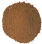
مقداری خاک رس