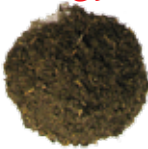
مقداری خاک باغچه