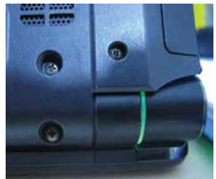
انواع پیچ و کاربردهای آن