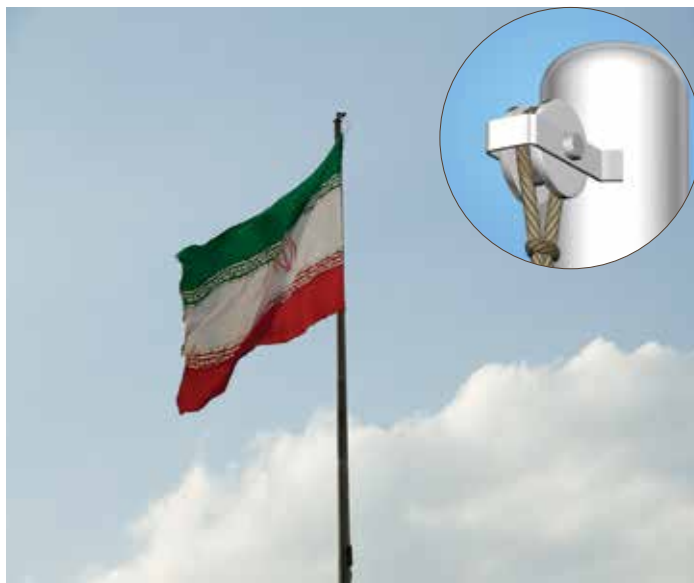
شکل ۳. کاربردهای قرقره

وقتی کار ساختمان‌سازی به طبقه‌های بالا می‌رسد، با استفاده از سطح شیب‌دار نمی‌توانیم اجسام را تا ارتفاع زیادی بالا ببریم. برای این کار از قرقره استفاده می‌کنیم. در شکل‌های زیر بعضی از کاربردهای قرقره را می‌بینید.