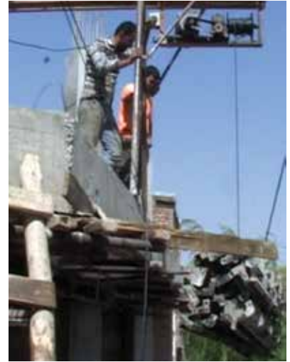
ب) بالا بردن مصالح ساختمانی