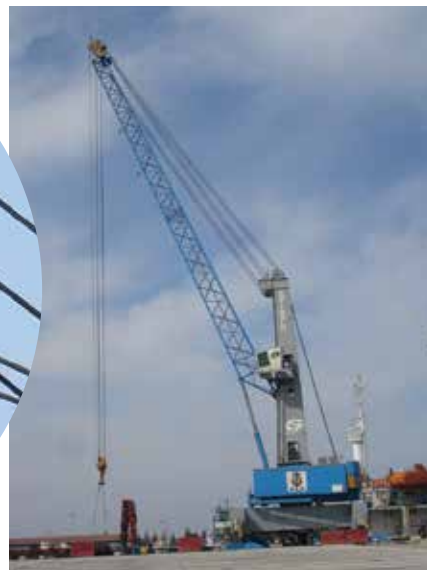
ج) بالا بردن اجسام سنگین