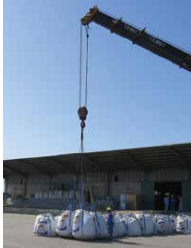
پ) جابه جایی اجسام سنگین