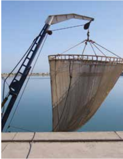
ت) بالا کشیدن تور ماهیگیری